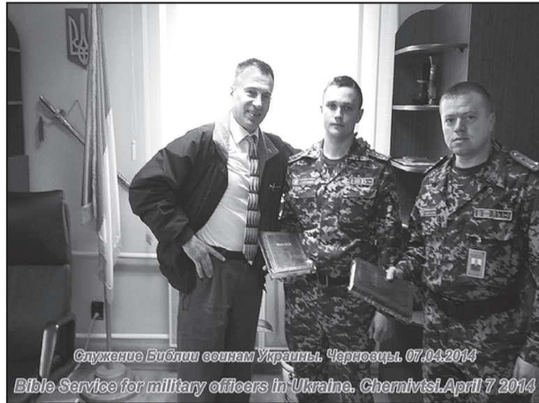
Служення Біблії військовим України. Чернівці. 07.04.2014 Bible Service for military officers in Ukraine. Chernivtsi April 7 2014