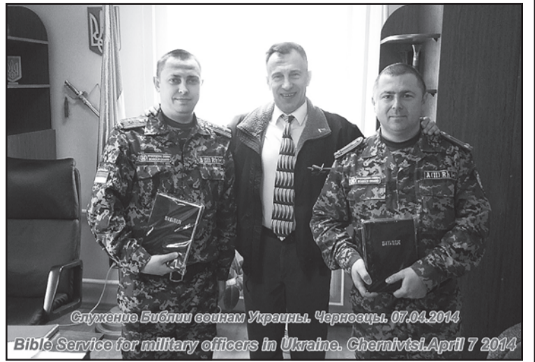
Служення Біблії військовим України. Чернівці. 07.04.2014 Bible Service for military officers in Ukraine. Chernivtsi April 7 2014

Щоб верба і тополя соковито виділяли кисень і щоб якщо висохне трава, то не від пострілів гармат, а черговою порою кінця літа. «Послухом правді очистьте душі свої через Духа на на нелицемірну братерську любов, і ревно від широго серця любіть один одного, бо народжені ви не з тлінного насіння, але з нетлінного, Словом Божим жи-